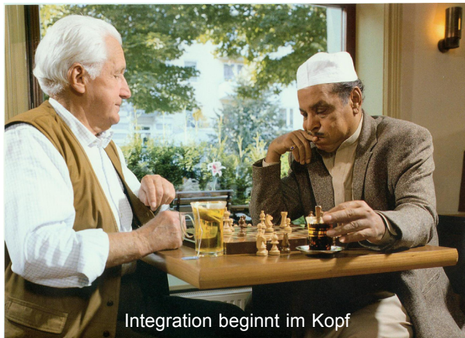
Integration beginnt im Kopf